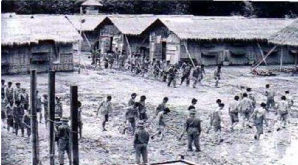
Chưa phải là bất hàng chục vạn người "làm việc cho chế độ cũ" phải "học tập cải tạo" và vùi xác ở đồi hoang núi lạnh,