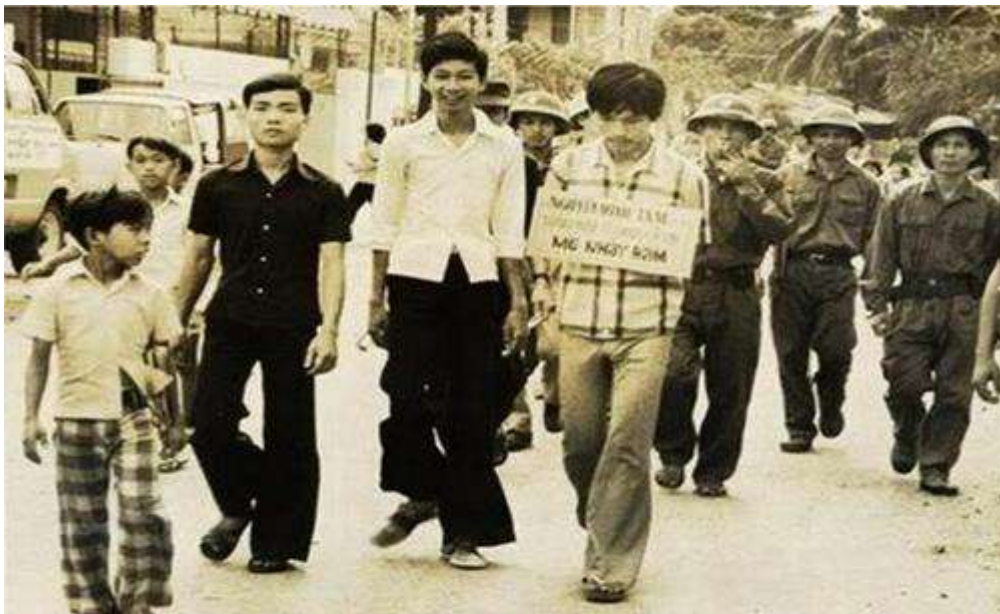
Chưa phải là "đánh tư sản" để cưỡng đoạt nhà cửa, tài sản và đẩy hàng triệu người dân "chế độ cũ" lên những vùng ma thiêng nước độc,