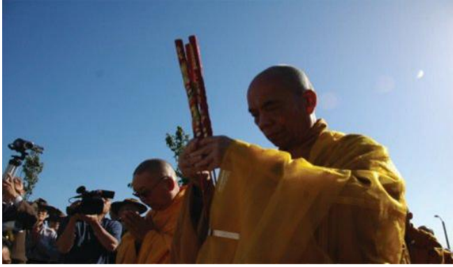
Đại lão Hòa thượng Thích Chánh Lạc niêm hương làm lễ Cầu siêu tại hai Tượng đài Việt Mỹ và Tượng đài Người Vượt Biển ở thành phố Westminster