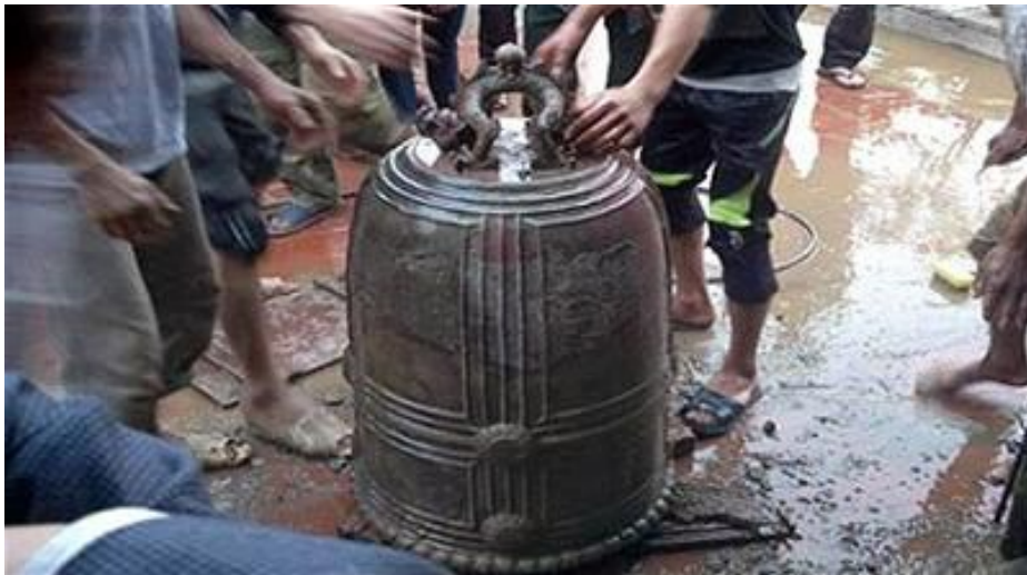
Chiếc chuông đồng được người dân rửa sạch bùn đất.