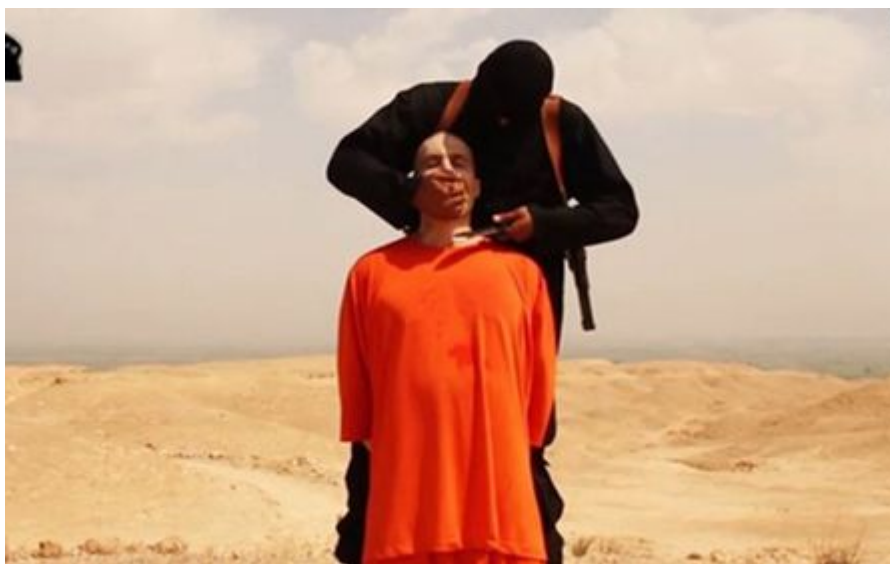
Cảnh khủng bố IS hành quyết nhà báo Mỹ James Foley gây bàng hoàng cho toàn thế giới.

Chỉ trong tháng 6/2014, ISIS bắt đầu mở chiến dịch tấn công chiếm đóng nhiều khu vực ở Iraq, nắm quyền kiểm soát một vùng rộng lớn ở Syria, tuyên bố thành lập vương quốc Hồi giáo và đổi tên thành Nhà nước Hồi giáo (IS). Ngày 19/8, IS khiến thế giới bàng hoàng khi liên tiếp tung lên mạng các đoạn video quay cảnh cắt đầu các công dân Mỹ, Pháp, Anh.