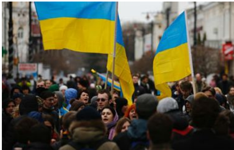
Khủng hoảng chính trị Ukraine vẫn chưa có hồi kết.

Năm 2014 chứng kiến nhiều biến chuyển lớn trong khủng hoảng chính trị ở Ukraine từ việc "phế truất" cựu Tổng thống Yanuovych hồi tháng 2; "ông trùm kẹo ngọt" Petro Poroshenko đắc cử Tổng thống Ukraine cũng như vùng Đông Ukraine đơn phương tuyên bố thành lập các nhà nước cộng hòa ly khai dẫn đến cuộc xung đột đẫm máu trong khu vực giữa quân đội Kiev và các lực lượng ly khai địa phương.