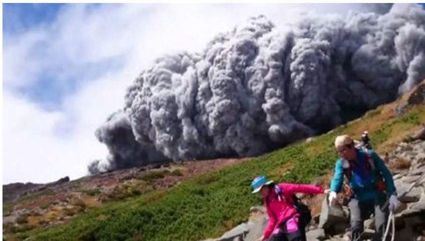
Thảm họa núi lửa Ontake khiến gần 50 người thiệt mạng.

Được coi là thảm họa núi lửa tồi tệ nhất ở Nhật Bản kể từ sau Chiến tranh Thế giới thứ Hai. Tính cho đến nay, công tác tìm kiếm và cứu nạn vẫn tiếp tục với sự tham gia của khoảng 1.000 cảnh sát và binh sĩ lực lượng phòng vệ mặt đất. Nhiều nạn nhân đã được đưa ra khỏi ngọn núi này.