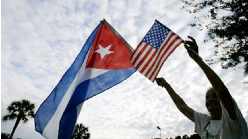
Người dân Cuba vui mừng sau khi Cuba - Mỹ bình thường hóa quan hệ

Tổng thống Barack Obama ca ngợi, đây là "thay đổi quan trọng nhất trong chính sách của Hoa Kỳ với Cuba trong vòng 50 năm qua". Còn người dân Cuba đổ ra đường ăn mừng sau khi hai nước đạt được thỏa thuận bình thường hóa sau hơn nửa thế kỷ chờ đợi. Mỹ áp đặt lệnh cấm vận kinh tế đối với Cuba năm 1960 và hai nước không có quan hệ ngoại giao kể từ năm 1961.