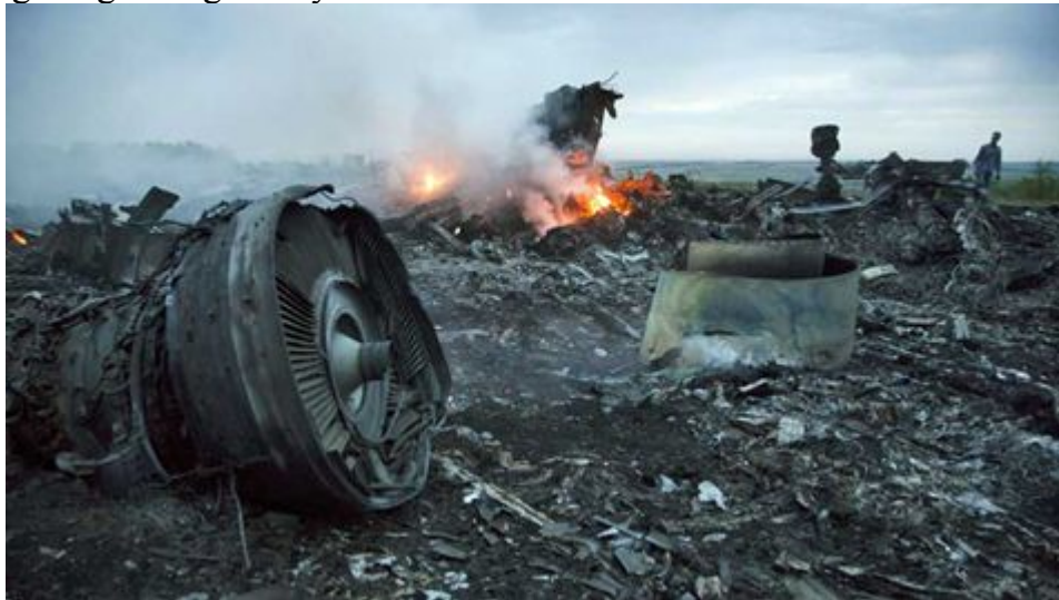
Hiện trường vụ rơi máy bay MH17 .

Tính riêng trong năm 2014, thế giới đã chứng kiến gần 20 vụ tai nạn máy bay làm hơn 1.000 người thiệt mạng và mất tích. Tiêu biểu nhất trong số đó là 2 vụ tai nạn của hãng hàng không Malaysia Airline.