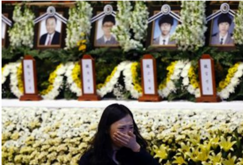
Vụ chìm phà Sewol khiến gần 300 người thiệt mạng.

trên đường từ Incheon đến đảo Jeju của Hàn Quốc. Sau khi phát tín hiệu cấp cứu vào lúc 8h58 khi cách đảo Byeongpung 20km, 1 tiếng sau chiếc tàu lật úp khiến 292 người thiệt mạng và 12 người khác hiện vẫn đang mất tích.