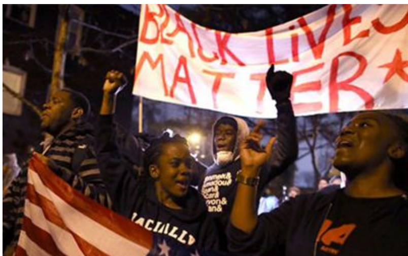
Biểu tình phản đối phân biệt chủng tộc lan rộng khắp nước Mỹ.

Ngày 24/11, bồi thẩm đoàn hạt St. Louis ra phán quyết đầy tranh cãi khi miễn truy tố đối với cảnh sát Darren Wilson - người đã bắn chết Michael Brown. Phán quyết này đã châm ngòi cho làn sóng biểu tình, bạo loạn chưa từng có ở Mỹ trong nhiều năm gần đây.