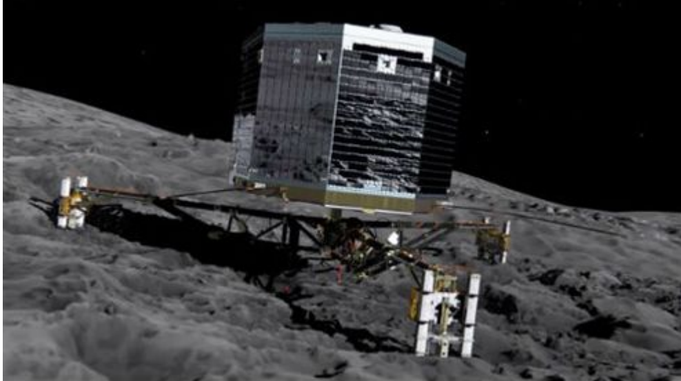
Tàu robot thăm dò sao Chổi Philae.

Ngày 12/11, lần đầu tiên trong lịch sử, con tàu Philae đáp xuống thành công xuống bề mặt sao Chổi 67P/Churyumov-Gerasimenko (67P/C-G).